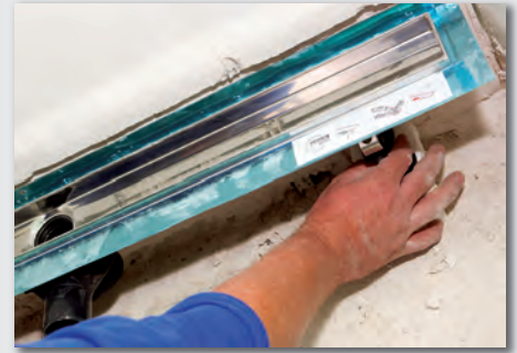
Bild 4: Eine behinderten- und altersgerechte Bauweise ist heutzutage fast schon Standard. Der Einbau einer bodengleichen Dusche inklusive Linienentwässerung von TECE ist dabei ein wesentlicher Bestandteil und trägt zur Zukunftsfähigkeit des Objekts mit bei.

Montagefüßen, Schallschutzkappe und der Drainbase-Schallschutzmatte profitieren die späteren Bewohner von einer effektiven Schallisolierung. Dass der Installationsschallpegel gerade mal 22 db(A) beträgt, ist in derartigen Wohneinheiten ein echtes Plus. Günther: „Die Anforderungen der DIN 4109 werden sogar erheblich unterschritten.“