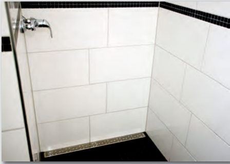
Bild 2: Sicher, barrierefrei und ästhetisch anspruchsvoll: In den Zwei-, Drei- und Vier-Zimmer-Appartements wird auch in den Sanitärräumen auf eine pragmatische und qualitativ hochwertige Gestaltung mit individuellen Akzenten Wert gelegt.