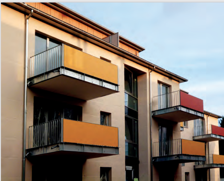
Bild 11: Der Stadtteil Weende in Göttingen in der Nähe zum universitären Zentrum wächst. Um dem Bedarf an zeitgemäßem Wohnraum gerecht zu werden, wurde das Projekt „Im Hassel“ in der gleichnamigen Straße ins Leben gerufen.

Der Wohnraum der Genossenschaft ist und bleibt erschwinglich: Die durchschnittliche Miete belief sich 2012 auf 4,81 Euro pro Quadratmeter – das ist deutlich unter der ortsüblichen Miete. Gerade in Zeiten steigender Mieten erlebt das Genossenschaftsprinzip eine Renaissance. So auch in der Universitätsstadt Göttingen, in der die Wohnungssituation als eher angespannt gilt. Davon profitiert die Volksheimstätte, Leerstand gibt es derzeit keinen.