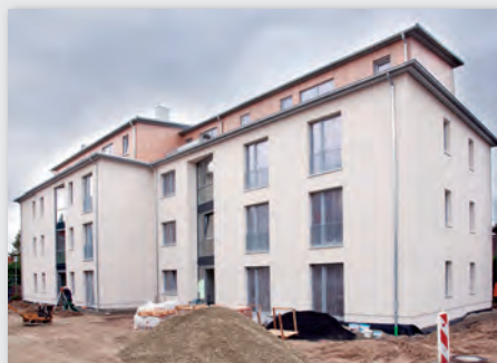
Bild 9: November vergangenen Jahres bezogen die ersten Mieter ihre Wohnungen. Mit „Im Hassel“ bietet die Genossenschaft – wie auch in den anderen Objekten – erschwinglichen Wohnraum.