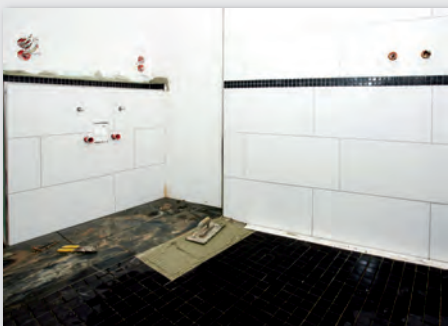
Bild 8: Im Bad (hier noch in der Baustellensituation) setzte die Volksheimstätte auf hochwertige Oberflächen. Die verbauten Produkte sollen über Generationen hinweg zuverlässig funktionieren und ihre Qualität auch bei intensiver Nutzung wahren. Mit TECE Drainline trägt der Emsdettener Haustechnik-Spezialist TECE seinen Teil dazu bei.

Gegründet wurde die Göttinger Wohnungsbaugenossenschaft im Jahre 1948. Das Ziel: die Wohnungsnot nach dem Zweiten Welt-