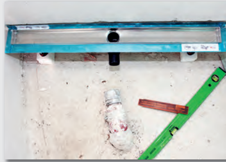
Bild 6: TECEDrainline – in den Maßen 800 bis 1.200 Millimeter verbaut – fügen sich nahtlos in die Bodengestaltung ein. Bei einer Aufbauhöhe von 120 Millimetern wurde „Im Hassel“ die gerade Rinne mit einer waagrecht ablaufenden (Leistung 0,80 l/s) eingesetzt.