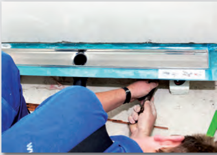
Bild 5: Ein echtes Plus in Wohneinheiten ist der Installationsschallpegel von gerade mal 22 db(A). Der Schall- und Brandschutz der TECEDrainline-Duschrinne wurde weiter optimiert: Dank Montagefüßen, Schallschutzkappe und der Drainbase-Schallschutzmatte profitieren die späteren Bewohner in Göttingen von einer effektiven Schallisolierung.