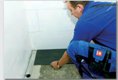
Bild 7: Um den hohen Wohnstandard zu kompletieren, wurde auf Barrierefreiheit ein besonderes Augenmerk gelegt. Der bauleitende Monteur Torsten Klan von der Herwig GmbH Heizung und Sanitär zeigt, wie optimal sich TECEDrainline in die großformatigen Fliesen einfügt.

krieg mit bezahlbarem Wohnraum vor Ort zu verringern. Mehr als 2.500 genossenschaftseigene Wohnungen sowie mehr als 1.300 Eigentumswohnungen bewirtschaftet und verwaltet die Volksheimstätte heute. Auf einer Fläche von insgesamt etwa 165.000 Quadratmetern bietet sie ihren mehr als 4.800 Mitgliedern preisgünstigen Mietraum.