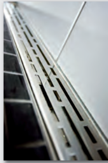
Bild 3: Barrierefreier Wohnraum steht „Im Hassel“ im Vordergrund. Mit TECE Drainline Duschrinnen mit der polierten Edelstahlabdeckung „basic“ wird dieses Konzept komplettiert.