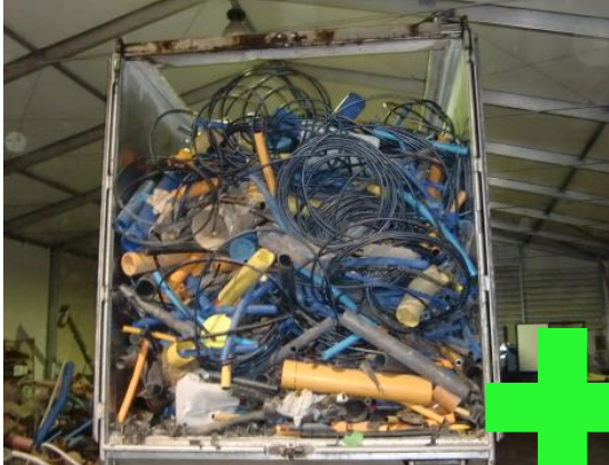
Fehlerhaft sortierte lose Schüttung Rohrmix: