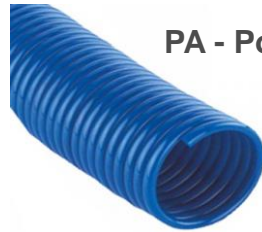
PA - Polyamid