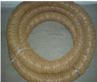
Drainagerohre mit Kokosummantelung