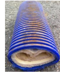
Rohre mit Dämmmaterial