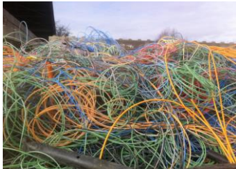
Schläuche & Rohre aus Mehrfachrohren

Folgende Beispiel-Fractionen übernehmen wir nicht :