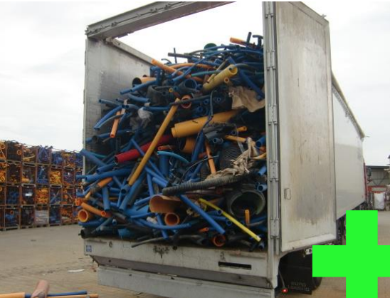
Korrekt sortierte lose Schüttung Rohrmix: