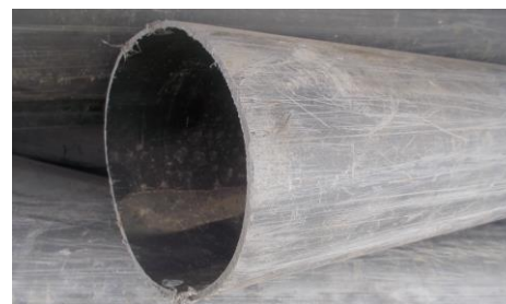
PP Rohre gefüllt