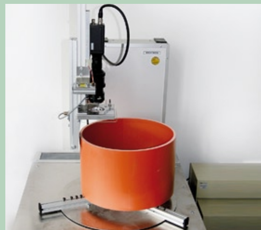
Nachweis der gleichmäßigen Schaumstruktur sowie der Wandungsmaße Prüfung der Gleichmäßigkeit der Schaumstruktur sowie der Maße des Wandaufbaus durch ein Bildanalyse-System

Konzept und Idee: www.lesch-consult.de Gestaltung: www.buena-la-vista.de