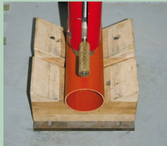
Nachweis der hohen Bruchfestigkeit Kugelfalltest nach DIN EN 744